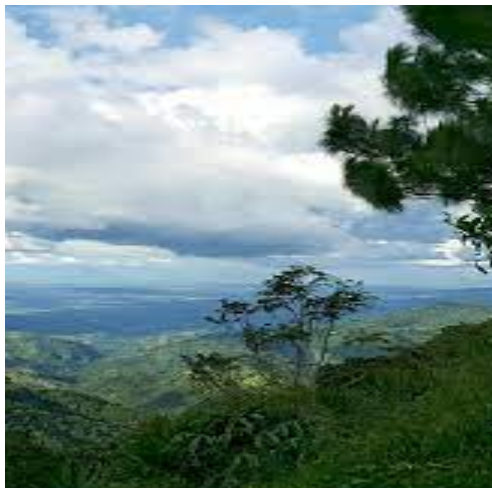
Fotografía tomada de internet.